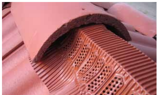
Paigaldus samm 6. Asetage harjakivi tihendi peale ja kinnitage see ettenähtud tarvikutega.