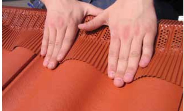
Paigaldus samm 4. Pressige ülevalt nii, et harjatihend oleks vastu katusekivi. Veenduge, et servad oleks korralikult vastu katusekive, et tagada optimaalne tihedus.