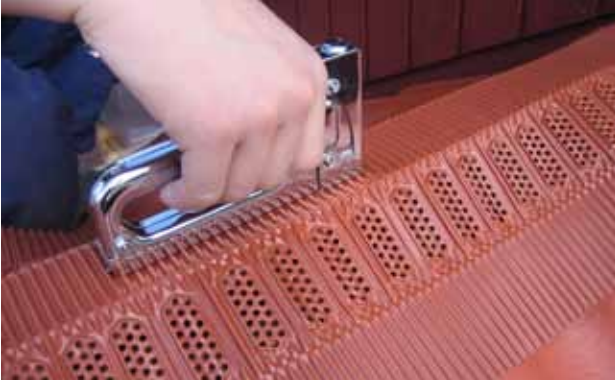
Paigaldus samm 1. Asetage rull harjaroovi keskele. Kinnitage harjatihend kinnitusdetailidega regulaarse vahemaaga ca 30cm. Kinnitage kinnitusklambritega.