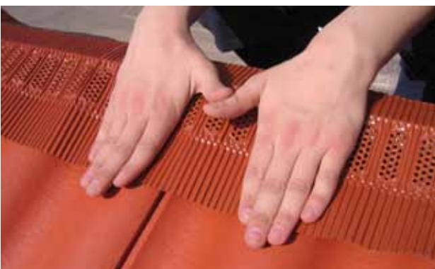
Paigaldus samm 3. Pressige tihendi serva nii, et surute selle vastu katusekive. Veenduge, et tihendusrolli õhutusavad ei jääks harjalauale. Õhk peab saama vabalt liikuda katusekivide alt ülesse kuni katuseharjakivini, et tagada nõutekohane tuulutus.