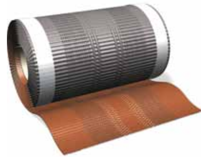
Pilt: Universaalne harjatihend

Paigaldusjuhised koos piltidega leiате lehelt 2.