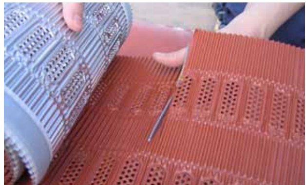
Paigaldus samm 5. Lõigata saab kääridega või terava noaga.