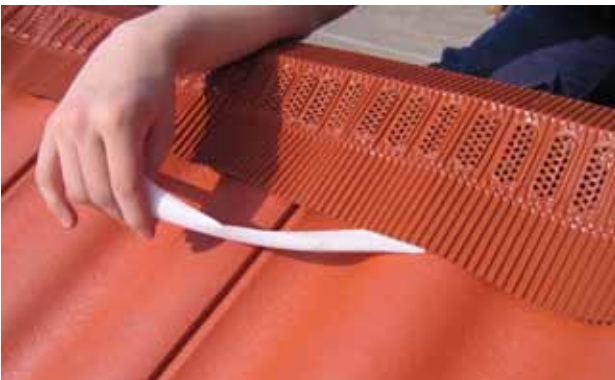
Paigaldus samm 2. Eemaldage kaitsekile paralleelselt paigaldatud suunas.