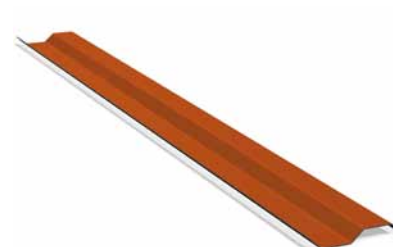
Pilt 2: Liigendusliist