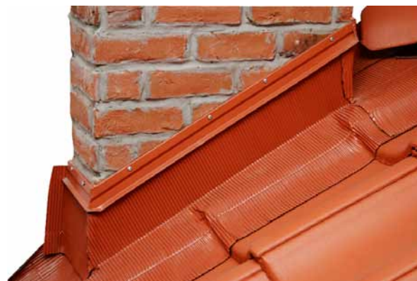
Pilt 3: Katusele paigaldatud korstna tihenduslint