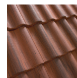
Antikk Tegl rød/ Svart 19