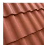
Tegl rød 14