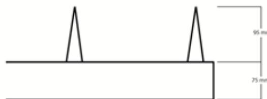
Totalhøyde 170 mm (95 mm under og 75 mm over bakkenivå)

Det ubehandlede produktet får etter en tid rustpatina.