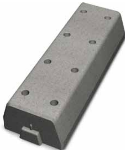
Bender Spikma Mittstöd

Mittstödet är ett självklart val för att avgränsa parkeringar och lagerytor eller som filmarkering vid terminaler. Tack vare den dränerande konstruktionen undviks vattenansamlingar på fel ställen. Mjuka avslutningar finns, liksom stöd med hål för reflexstolpe eller 2-tums rör för skyltmarkering. Toppbelaggeningen av asfalt utföres alltid mot stödet för att få ett icke avvisande stöd. Stöden levereras med förmonterade rostfria stålspikar i bussningar för stabil infästning och montering året runt.