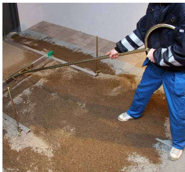
Bild 3. Dragstång för bekväm arbetsställning.