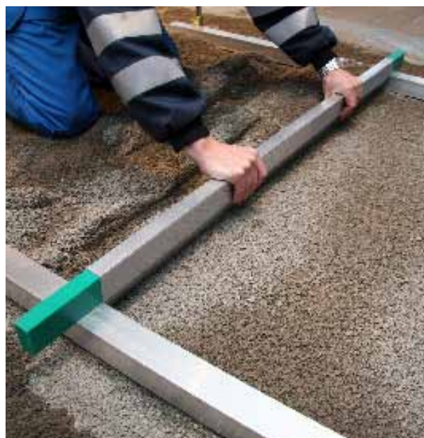
Bild 1. Banor och avdragsbräda.

Systemet kan kompletteras med en dragstång som fästes på avdragsbrädan. Då kan du arbeta stående när större ytor ska jämnas (bild 3).