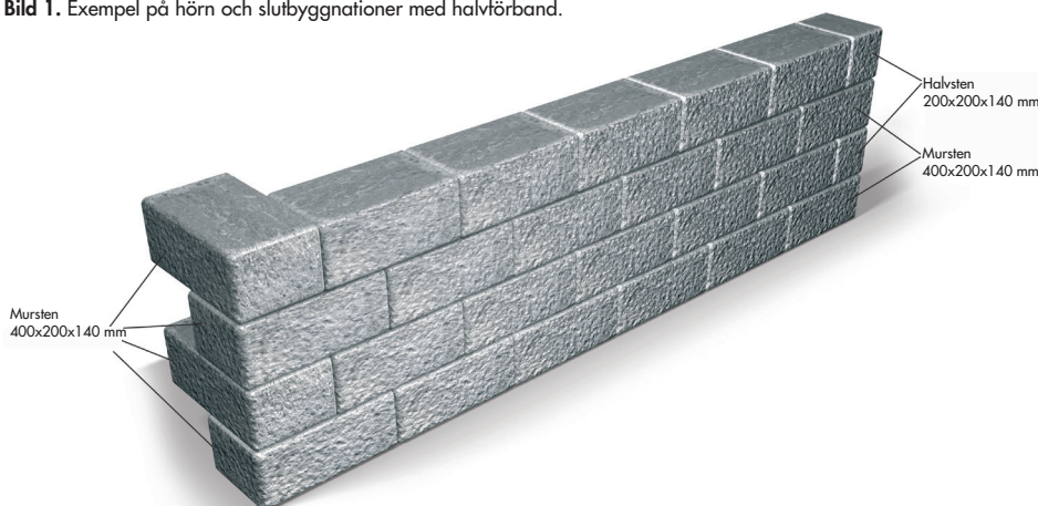
Bild 1. Exempel på hörn och slutbyggnationer med halvförband.

4. För svåra markförhållanden rekommenderas gjutning av betongsula som grund för muren.