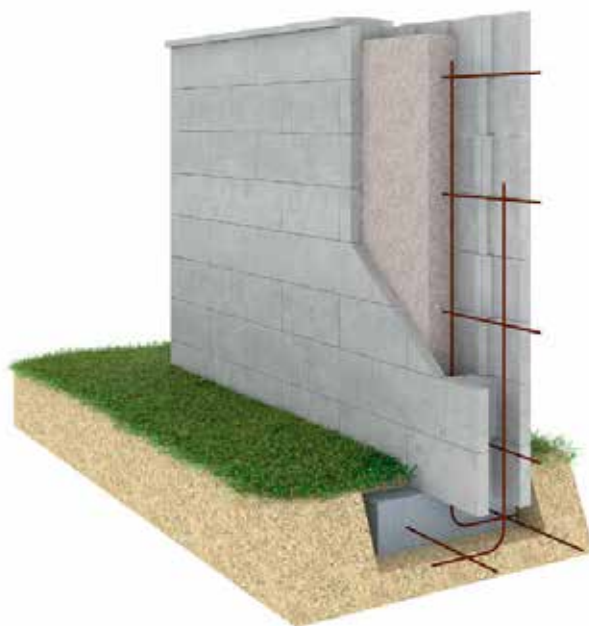
Bild 2. Exempel på hörn- och slutbyggnation.