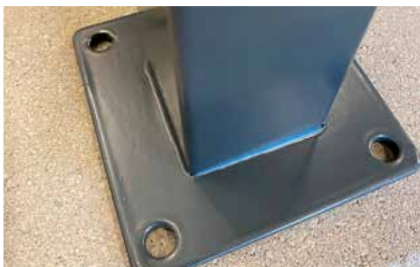
Bild 2. Smidesstolpens bottenplatta.