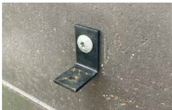
Bild 3. Vinkelfäste i betongstolpe.