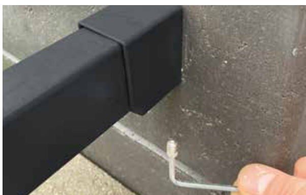
Bild 6. Låsskruvar till vinkelskydd.