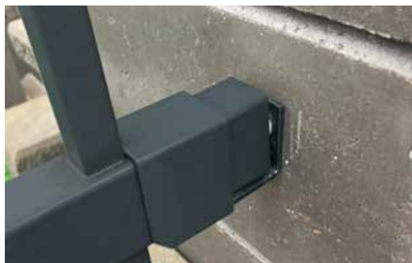
Bild 5. Vinkelskydd på skenan.