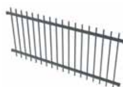
Classic smidesstaket hög 1975x900 mm Art nr 2970250