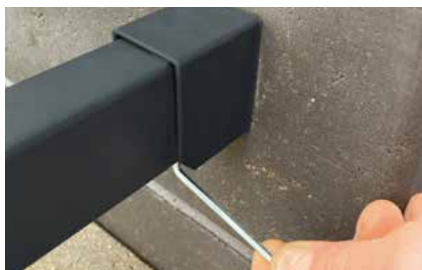
Bild 7. Låsning av vinkelskydd. OBS! Dra inte åt låsskruvarna för hårt!