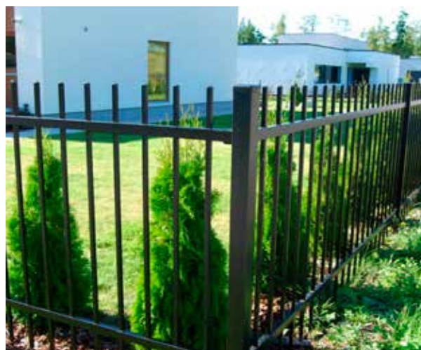
Exempelbild på hörn med smidesstolpar.

Staketen passar perfekt att montera upp på våra murar, mellan stolpar av våra stolpelement. De går självklart också att bygga kontinuerligt med tillhörande stolpar. Classic smidesstolpe kan användas som start-/slutstolpe, men även som mittstolpe och hörnstolpe. Detta tack vare sina vinkelfästen, som man enkelt monterar själv, samt dess fyrkantiga profil på 50x50 mm.