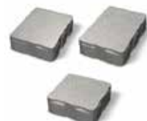
Ocala multisize 50 mm Art nr 22210xxB