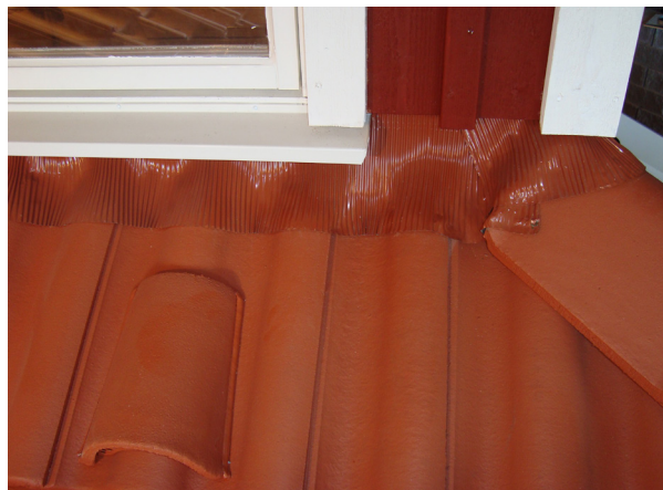
Montering av vägganslutning. På bilden syns även Luftningspannan, se texten.