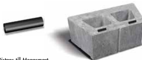
Distans till Megasmart. Se distansernas placering på murblocket.

Avsluta muren med Bender Megatäck avtäckningsplatta eller Bender Bohusgranit Avtäckning, som limmas noggrant (Lim PL 800 eller PU 700).