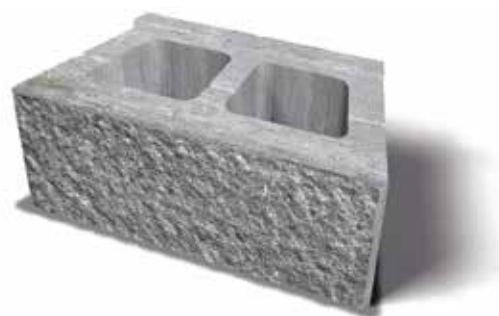
Megasmart 400x200x150 mm

Fyll på ett dräneringsskikt av finmakadam 8-16 mm till en bredd av minst 15 cm bakom muren. Samma finmakadam kan användas till att fylla hålutrymmet i murblocket. För extra stabilitet kan hålutrymmet i murblocket fyllas med jordfuktig betong. I de fall dräneringsrör används skall detta placeras bakom blocken med jämnt fall så att vattnet leds bort från muren. Till