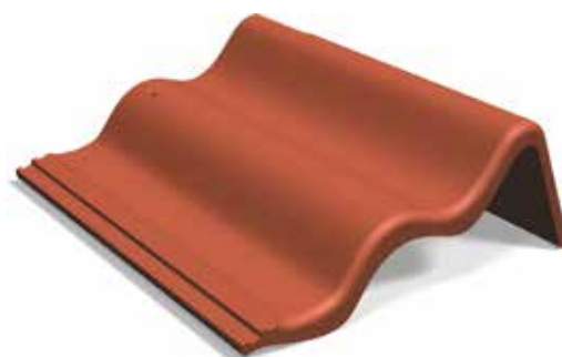
Gavelpanna höger, 88 klipp/110 klipp

Vid läggning med gavelpannor bör alltid yttre raden runt hela ytan läggas först för att säkerställa rätt avslutning.