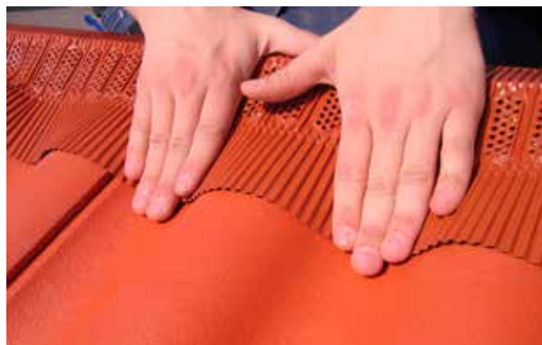
Montering steg 4. Pressa från toppen på takpannan ner mot vågdalen. Var noga med att kanten sluter till ordentligt, för en optimal tätning mot takpannorna.