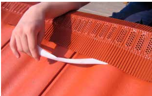
Montering steg 2. Tag bort skyddstejpen parallellt med läggningsriktningen.