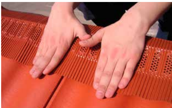
Montering steg 3. Vik ner kanten, forma rullen mot takpannornas toppar. Var noga med att luftningsdelen på rullen ej hamnar direkt mot nockplankan. Luften skall gå fritt från underkant av takpanna tills den går ut under nockpannan.