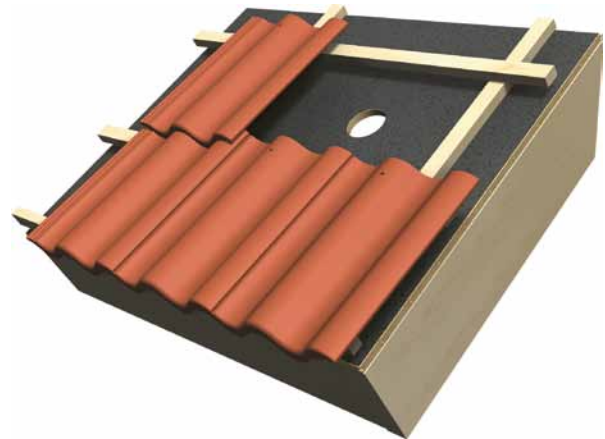
1. Tee n. 100 mm reikä aluskatteeseen.