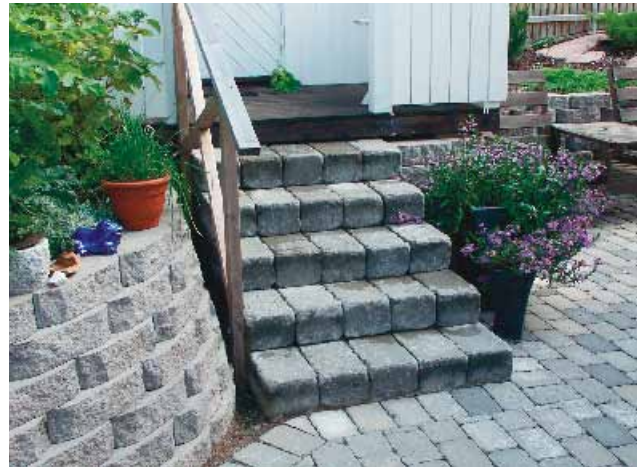
Labyrinth Antik Maxi-kivestä tehty porras. Muurikivi Bender Megastone 150 pyöreäksi lohkottu.