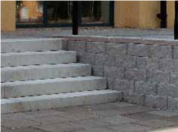
Bender Porraskivestä tehty porras. Muurikivi Bender Megastone 150 suoraksi lohkottu.