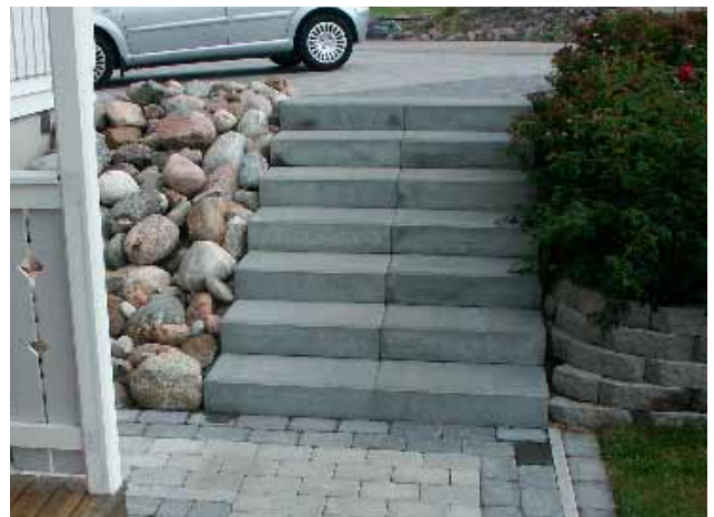
Bender Porraskivestä tehty porras.