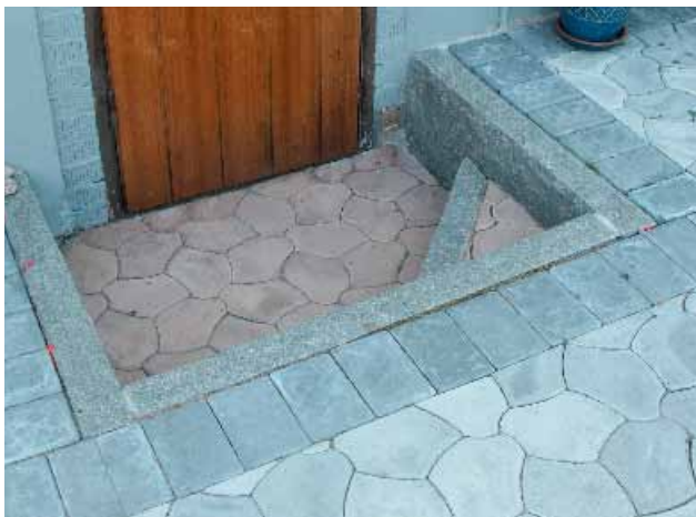
Graniitista ja Bender Pompeiji kivestä tehty porras.