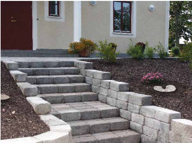
Labyrinth Antik Maxi-kivestä tehty porras