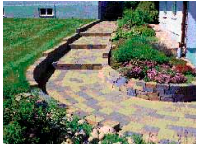
Bender Antik Labyrinth Kokokivestä tehty porras.