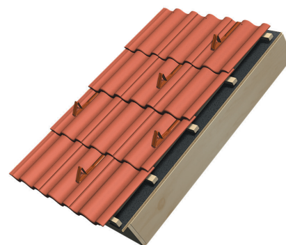
Fixierung in die Dachlatte