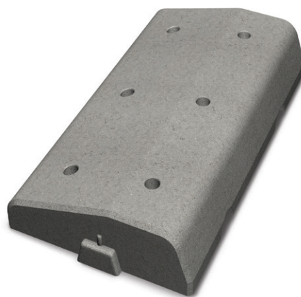
Bender Spikma GCM-stöd