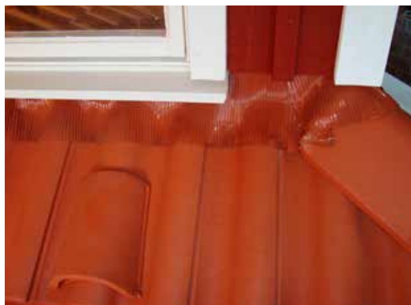
Montering av vägganslutning. På bilden syns även Luftningspannan, se texten.