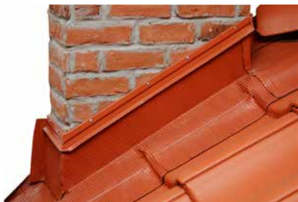
Montering av skorstenstätning