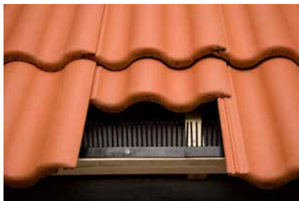
Montering av fågelband