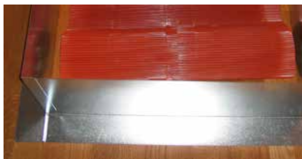
Underbeslag, plisséplåt och påse med monteringsdetaljer