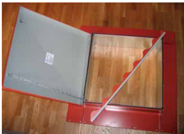
Överbeslag och pannprofilbeslag

Locket är kondensisolerat. Sidorna kan isoleras med 20 mm cellplast. Takluckan är typgodkänd av Sitac upp till och med snözon 2,5.