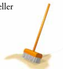
Efterfyll alla fogar.