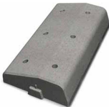
Bender Spikma GCM-stöd

GCM-stödet är ypperligt om man på ett enkelt sätt vill skilja på olika trafikantgrupper. Genom de olika höjderna är stöden avvisande mot fordonstrafiken och mjukt mot gång- och cykelbanan. Mjuka avslutningar finns liksom stöd med hål för reflexstolpe eller 2-tums rör för skyltmarkering. I stöden sitter förmonterat rostskyddande stålpikar i bussningar för en stabil infästning och montering året runt.