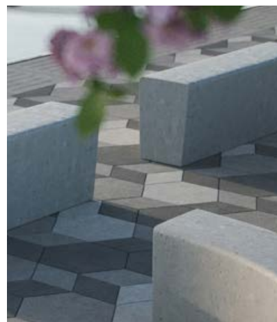
BENDER SIENA SITTBÄNKAR