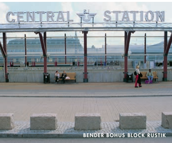
BENDER BOHUS BLOCK RUSTIK