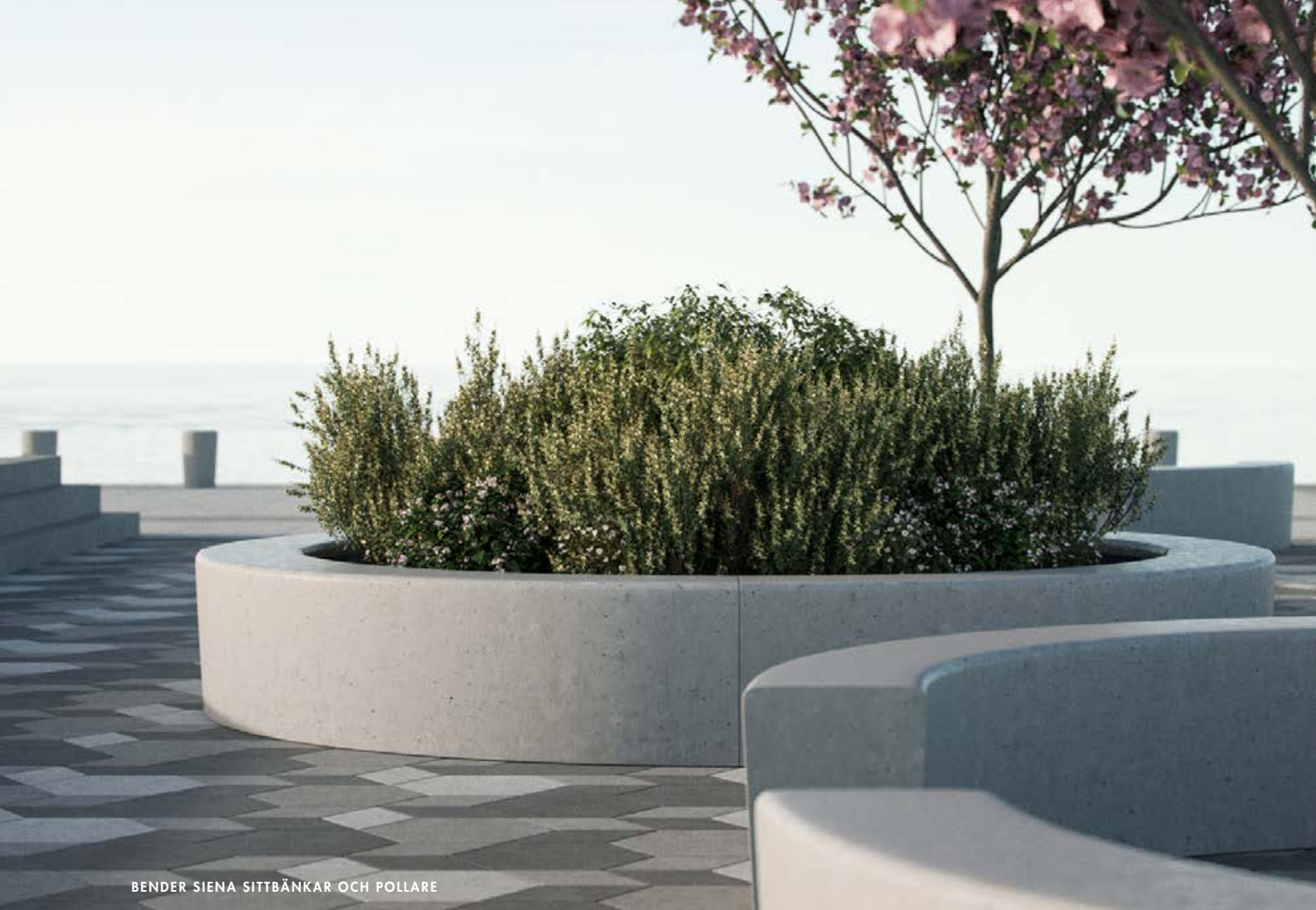
BENDER SIENA SITTBÄNKAR OCH POLLARE