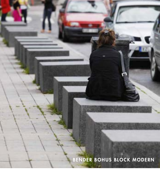
BENDER BOHUS BLOCK MODERN