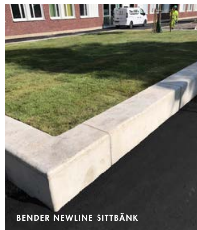
BENDER NEWLINE SITTBÄNK