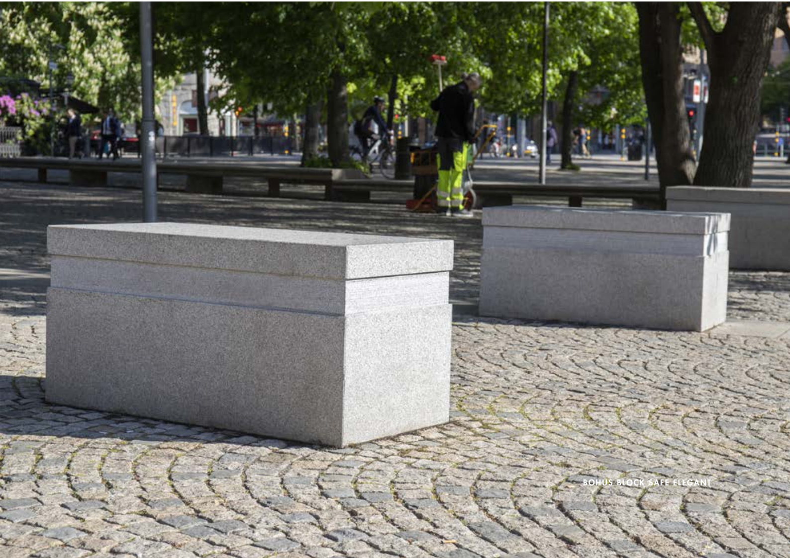
BOHUS BLOCK SAFE ELEGANT