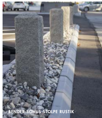
BENDER BOHUS STOLPE RUSTIK