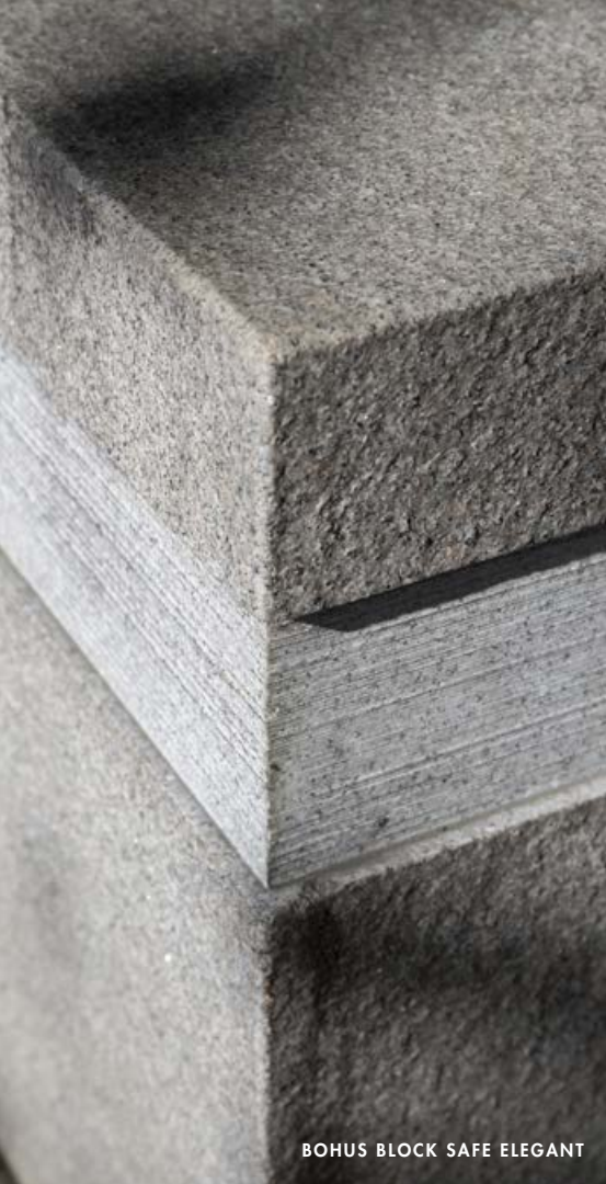
BOHUS BLOCK SAFE ELEGANT