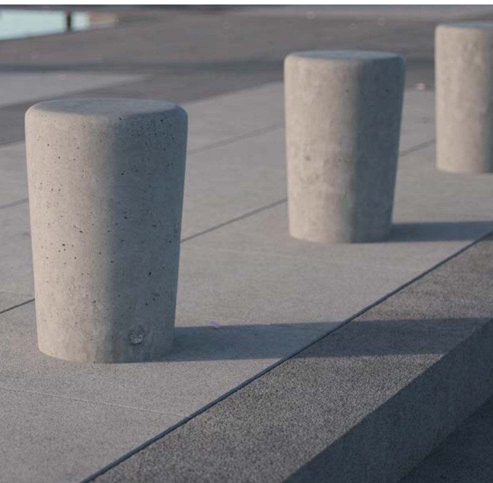
BENDER SIENA POLLARE