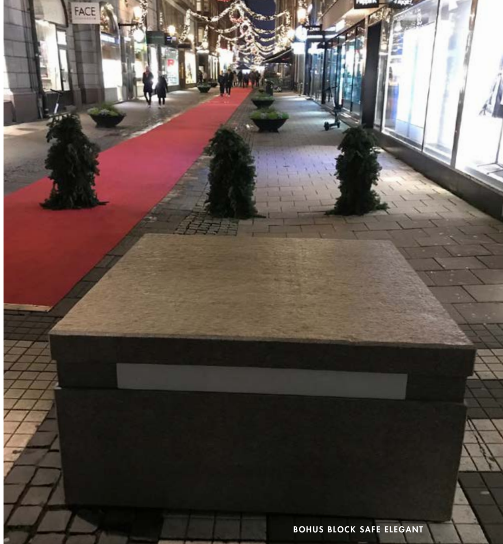
BOHUS BLOCK SAFE ELEGANT