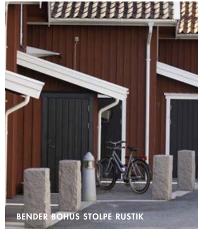
BENDER BOHUS STOLPE RUSTIK