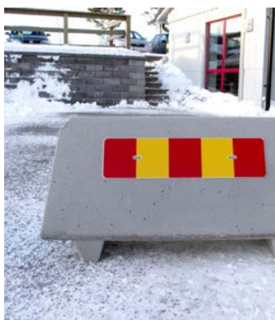
BENDER BETONGGRIS UTAN HÅL