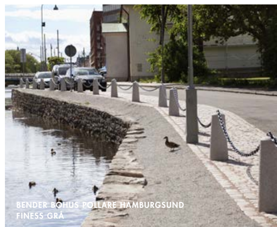
BENDER BOHUS POLLARE HAMBURGSUND FINESS GRÅ