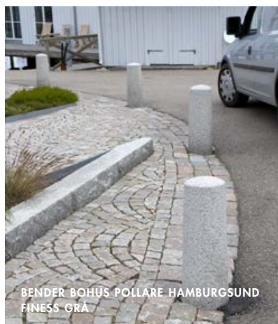
BENDER BOHUS POLLARE HAMBURGSUND FINESS GRÅ