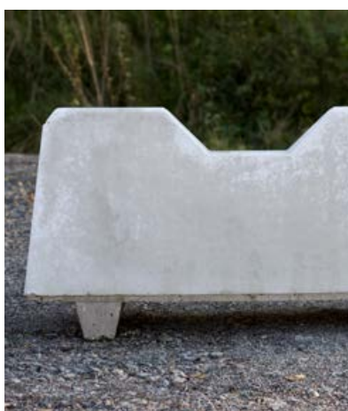
BENDER BETONGGRIS MED HÅL