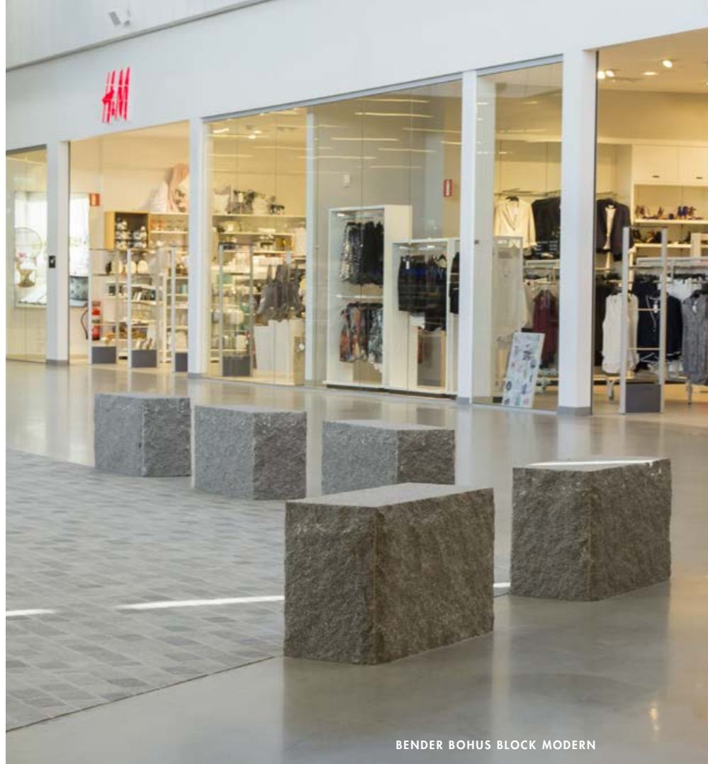
BENDER BOHUS BLOCK MODERN