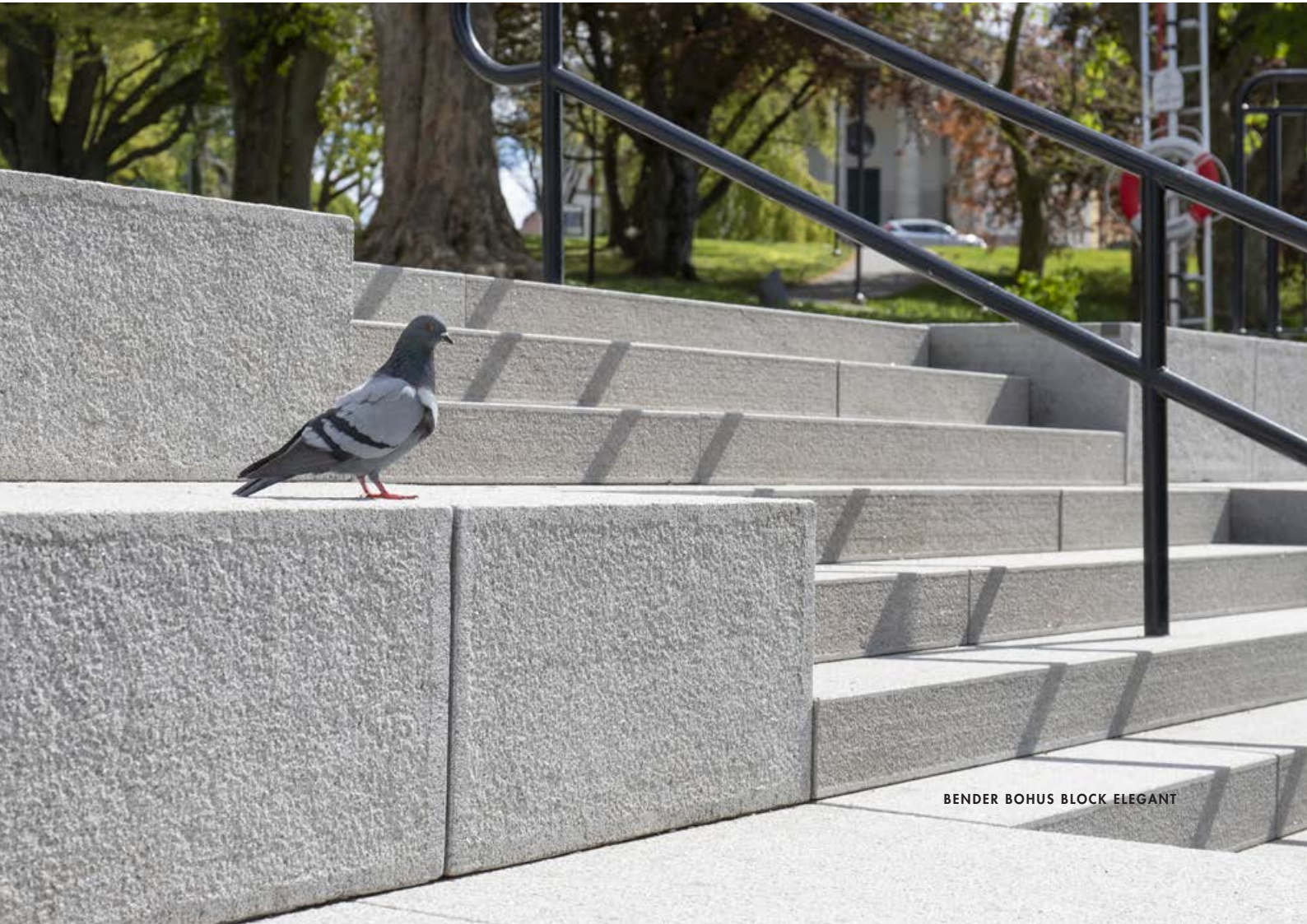
BENDER BOHUS BLOCK ELEGANT